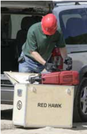
Una práctica caja de madera para un transporte fácil.

El uso de este versátil martillo neumático no tiene límites. Con una excelente relación potencia/peso, una frecuencia de percusión de 2600 golpes/minuto y una amplia gama de accesorios, con su Red Hawk los trabajos más duros parecerán fáciles.