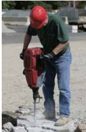
Rotura de hormigón.