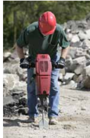
Perforado de suelos duros y helados.