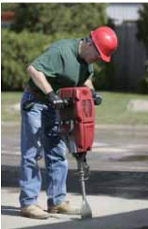
Corte de asfalto.