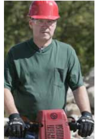
Los asideros con amortiguación de la vibración le harán notar la diferencia.