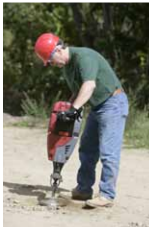
Bateado y compactado de tierra.