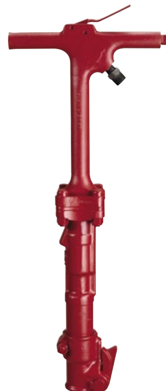
CP 0112 EX

Observación: Las herramientas sin silenciadores no poseen la Marca CE por lo que no deben venderse para uso en el EEE (Espacio Económico Europeo), es decir la UE además de Noruega, Islandia y Lichtenstein.